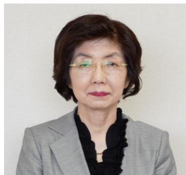
谷 委員 (教育長職務代理者)